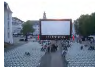
Kino-Open-Air, Schlossplatz Saarbrücken