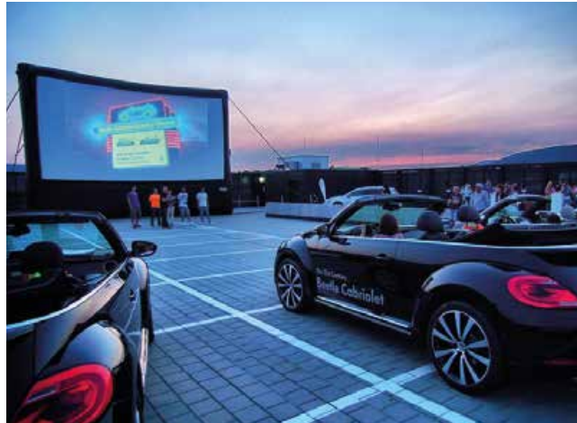
Autokino im VW Beetle auf einem Parkdeck über den Dächern von Zürich