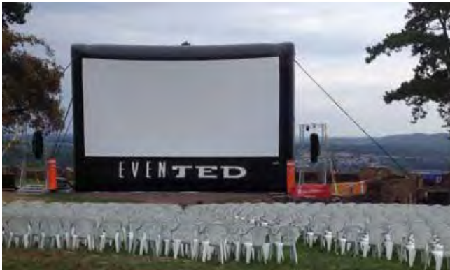
Kino auf der Burg, Rehlingen-Siersburg, mit Bestuhlung, vor und während der Filmvorführung