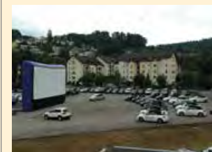
Autokino in Luzern (CH), VW Händler

Empfohlene Besucherkapazität bis maximal 1.200 Personen. Für Autokino bis maximal 120 Pkws geeignet.