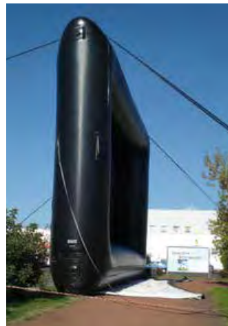
Aufstellen einer Leinwand 16m x 8m innerhalb weniger Minuten durch die Kraft eines leistungsstarken Gebläses