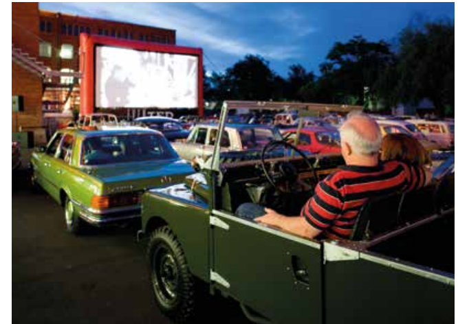
Ein lauer Sommerabend beim Autokino in der Klassikstadt in Frankfurt, Leinwandgröße 10m x 5m

Zu jeder Zeit bereit: Ein Auto-Kino ist wetterunabhängig und daher auch im Frühjahr und Herbst sehr gut durchführbar. Durch einen frühen Sonnenuntergang sind in dieser Zeit auch mehrere Vorstellungen an einem Abend möglich.