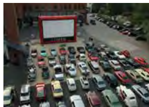
Autokino als Kundenveranstaltung, Klassikstadt Frankfurt

Empfohlene Besucherkapazität bis maximal 1.000 Personen. Für Autokino bis maximal 80 Pkws geeignet.