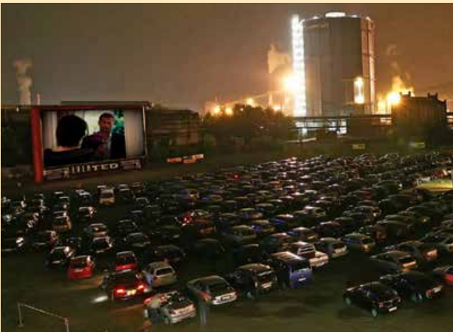
„Volles Haus“ mit etwa 500 Pkws beim Autokino am Gasometer des Weltkulturerbes Völklinger Hütte, Leinwand 24m x 11m

EVENTED bietet seit mehr als 15 Jahren Komplettlösungen für mobile Autokinos und Kino-Open-Air Veranstaltungen an. Vertrauen Sie unserer Erfahrung und Kreativität – wir haben für jeden Platz die passende Veranstaltung.