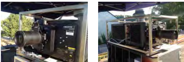
Hochleistungs-Beamer übernehmen heute die Bildprojektion

Die Filmprojektion läuft digital über Hochleistungs-Beamer. Der Film kommt von der Festplatte und wird nach dem internationalen DCI-Standard abgespielt (Digital-Cinema-Initiatives). Aber auch weitere Bildformate mit DVD oder BluRay, Präsentationsfolien oder Bilddateien können über digitale Filmprojektoren wiedergegeben werden. Wir verfügen über einen großen Bestand an Geräten zur digitalen Filmprojektion und haben die passende technische Infrastruktur wie Server und digitale Tonmischpulte. Weiterhin komplettieren verschiedenste Objektivgrößen unser Lager, um auch ungewöhnliche Projektionsentfernungen und Bildgrößen zu realisieren.