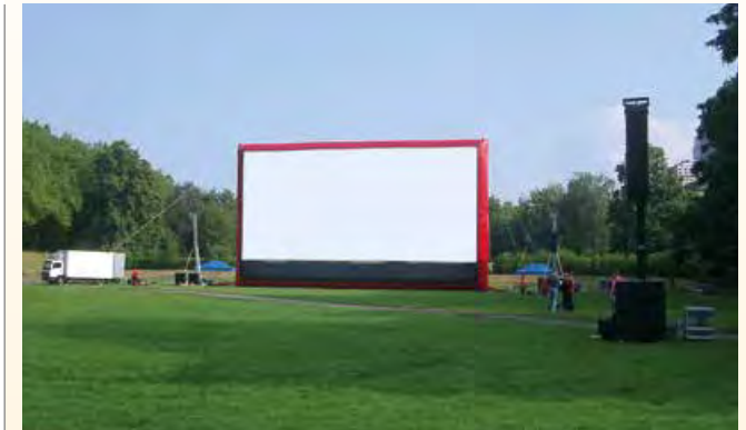
Kino-Open-Air Weltjugendtag Köln