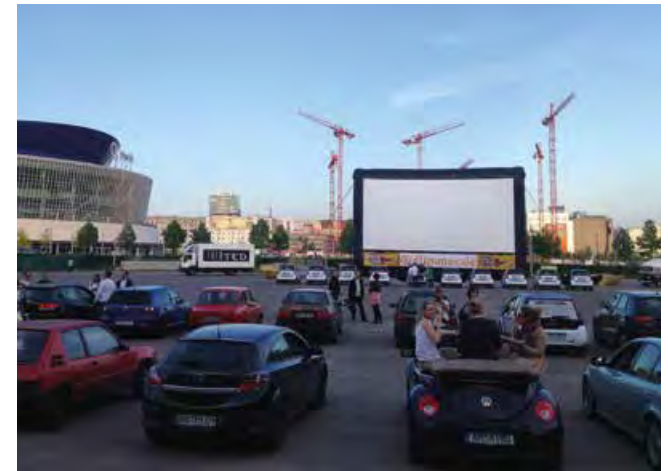
Entspannen in Berlin: Autokino an der O 2 World, Leinwand 16m x 8m