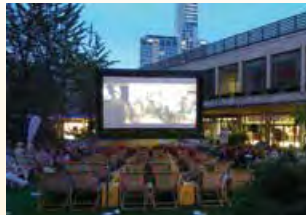
Kino-Open-Air Berlin, Neues Kranzler Eck