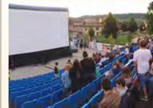
Kino-Open-Air in Rolle (CH), Stadtfest