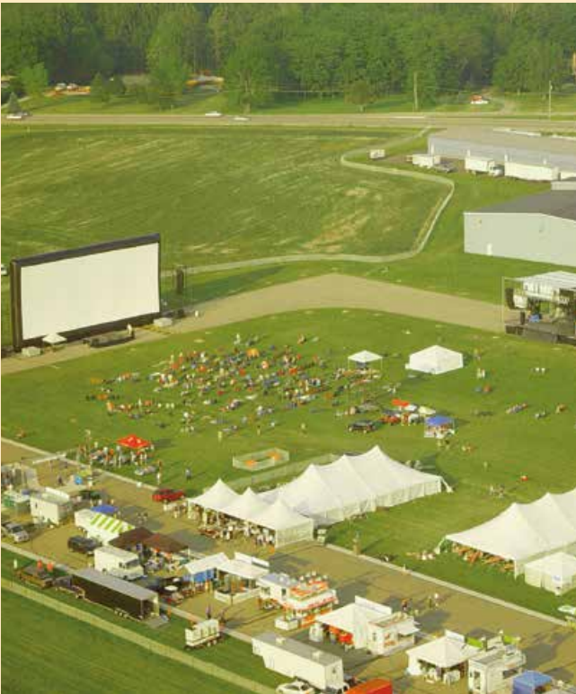
James-Dean-Filmfestival, Indiana (USA), Leinwand 24 m x 11 m

Aber auch Musikfestivals werden um eine Attraktion reicher, wenn bewegte Bilder auf großen Leinwänden und mit sattem Sound den Besuchern nochmals ein ganz besonderes Vergnügen bieten.