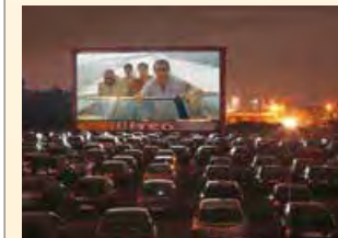
Autokino am Schacht Sophia Jacoba, Hückelhoven