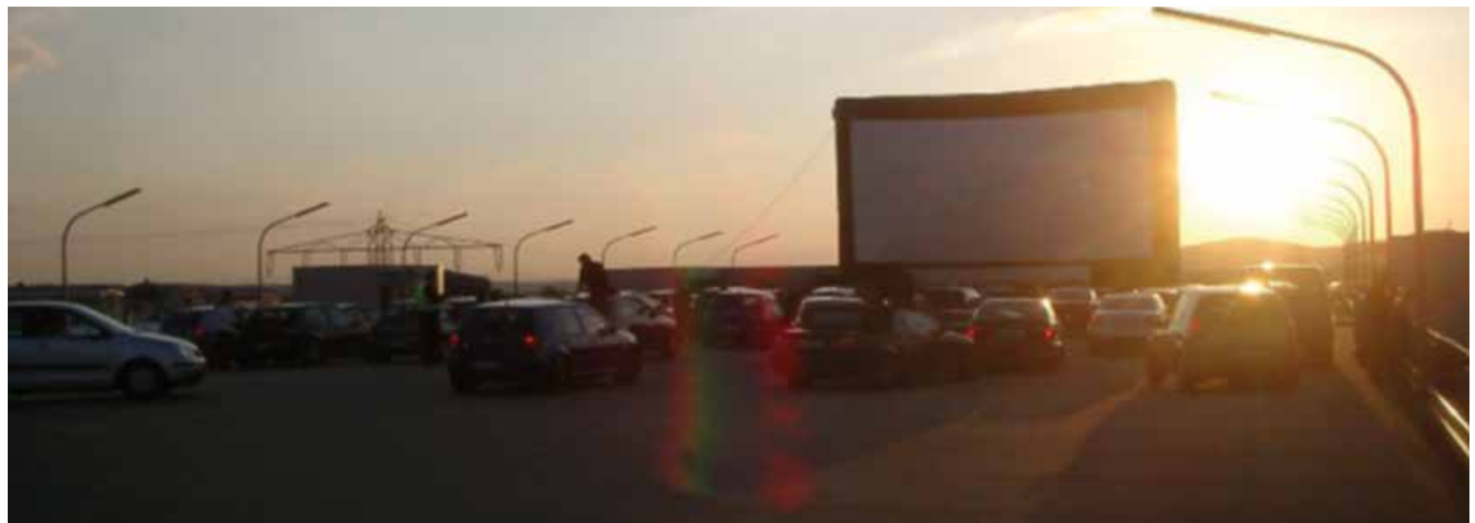
Sonnenuntergangsstimmung im Herbst auf einem Parkdeck in Bamberg, Leinwandgröße 16m x 8m