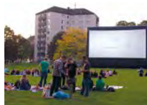
Kino-Open-Air Kennedypark, Aachen