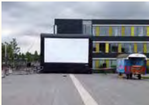
Kino-Open-Air in Geldern

Die Vielfalt unserer Kundenwünsche hat dazu geführt, dass wir ein sehr großes Portfolio an Leinwandgrößen auf Lager haben, um auch die ungewöhnlichsten Projekte zu realisieren. Dabei sollte die Leinwandgröße sowohl der Örtlichkeit angemessen sein als auch für die gewünschte Besucherkapazität ausreichen.