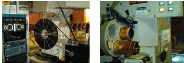
Filmprojektion im 35mm Format

Wer es lieber klassisch mag, der greift gerne auf die mehr als 100-jährige Filmprojektion mit 35mm Film zurück. Unsere modernen 35mm-Filmprojektoren zaubern auch auf größte Leinwandflächen ein unverwechselbares analoges Filmbild, das besonders bei den Klassikern der Filmgeschichte seine Wirkung entfaltet und typisches Kinofeeling erzeugt.