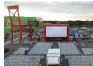
Kino-Open-Air in München- Aschheim, Möbelhaus