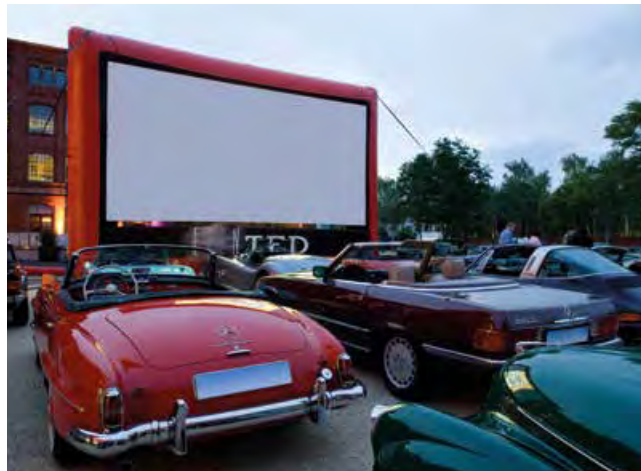
Filmschauen in einem Klassiker in Frankfurt, Leinwand 10m x 5m