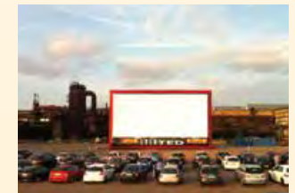
Autokino Weltkulturerbe Völklinger Hütte

4 Leinwandgröße 16 m x 8 m Bildunterkante 2,20 m