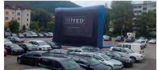
Rückseite eines AIRSCREEN® 12m x 6m

AIRSCREEN®-Leinwände werden immer mit einem Case zur witterungsgeschützten Unterbringung des Leinwandgebläses ausgeliefert. Auf Wunsch ist dieses Case nochmals schallgedämpt.