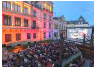
Kino-Open-Air in Luxemburg, Großherzoglicher Palast