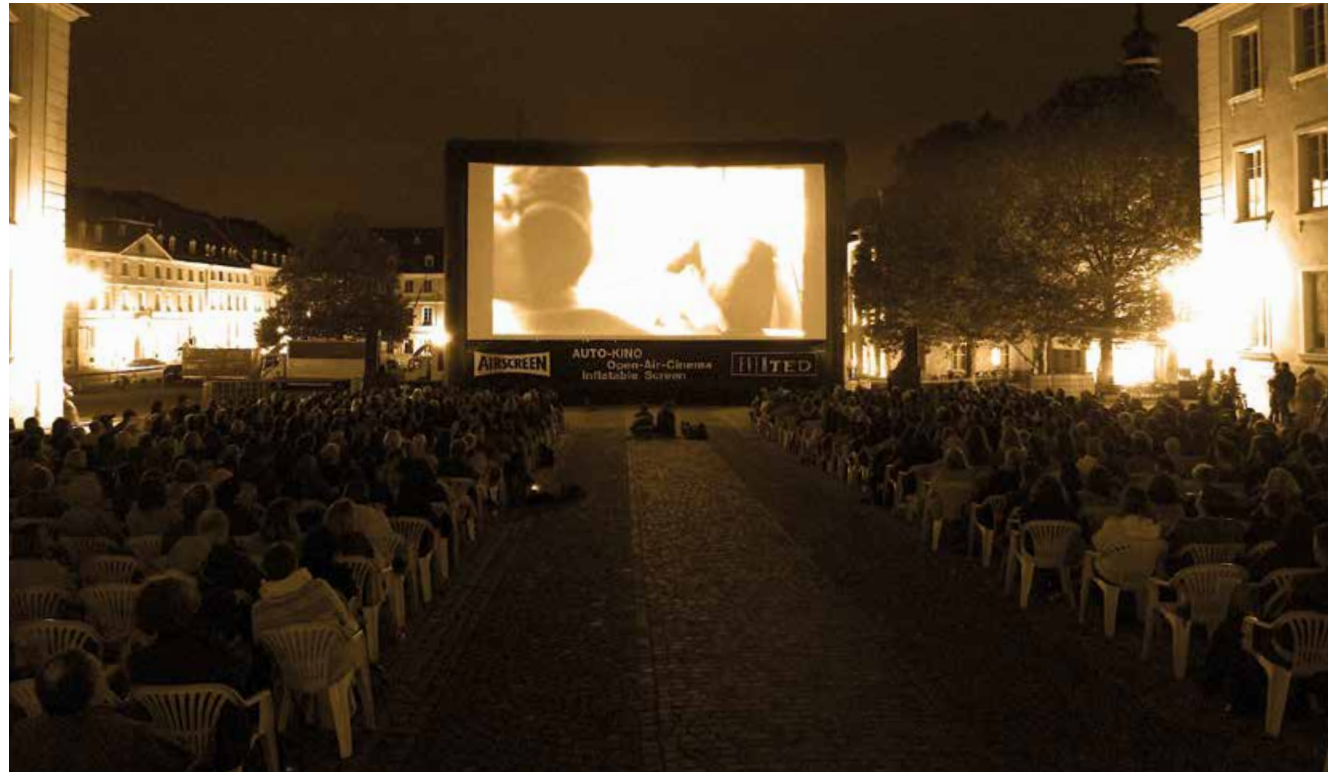
Kino-Open-Air mit „Ziemlich beste Freunde“ – ein absoluter Publikumsmagnet, Leinwand 16 m x 8 m auf dem Schlossplatz in Saarbrücken