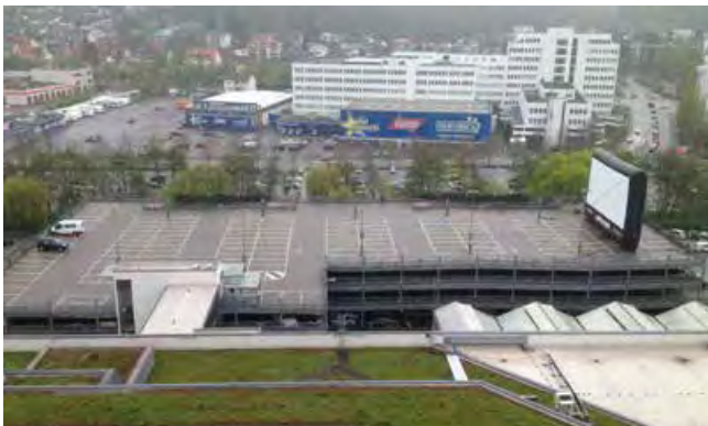
Autokino Breuninger Land, Sindelfingen