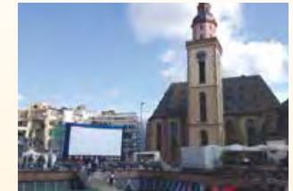
Kino-Open-Air in Frankfurt, Hauptwache